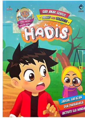
Jadual 2: Tajuk hadis di dalam buku Siri Anak Genius Soleh dan Solehah: Hadis